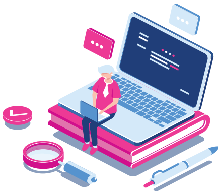
Live/Recorded Online Program