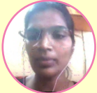
Minakshi Mahadev Civil Engineering Department : WRD-AE-2 Roll No. : PNO20069