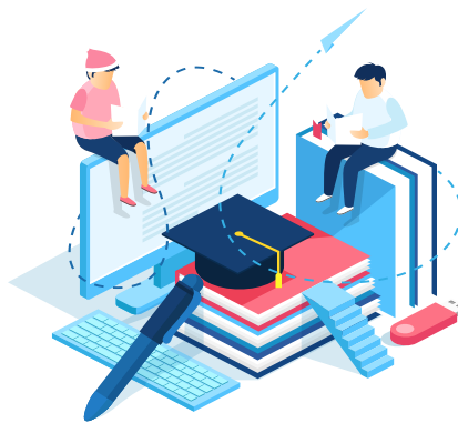
Books & Study Material