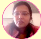
Arti Ghanshyam Civil Engineering Department : WRD-AE-2 Roll No. : NG006283