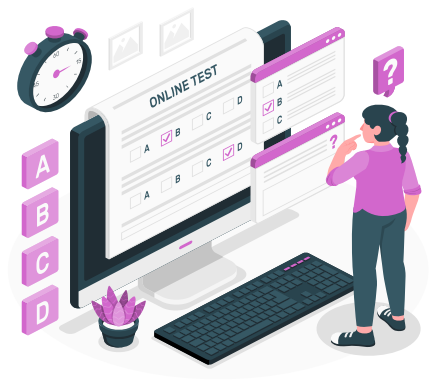
Online Test Series & Quiz